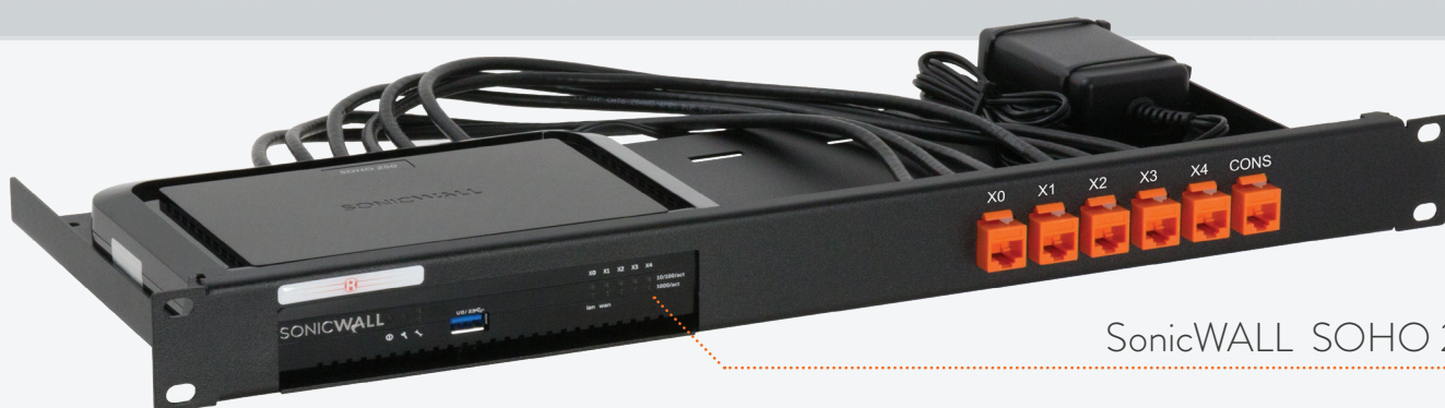
SonicWALL SOHO 250

MONTA SUL RACK IL TUO DISPOSITIVO SONICWALL CON SW-RACK