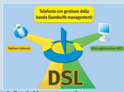
Funzione di gestione della banda (bandwidth management)